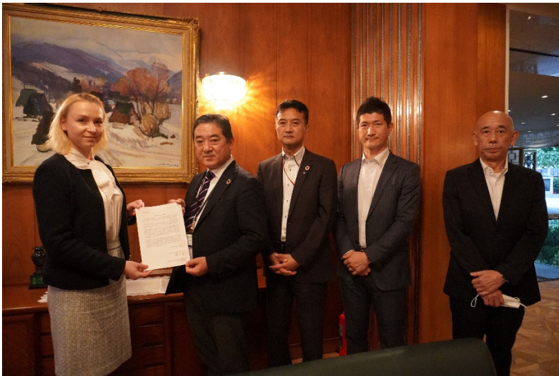
ロシア大使館で (岩附事務局長：右端)