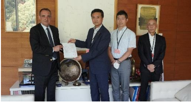
フランス大使館へ要請

KAKKIN は7月から9月にかけて、連合などと共に核兵器を保有している国の在日大使館を訪問し、核兵器廃絶の要請を行いました。7月26日はフランス、8月31日はアメリカ、9月22日は中国、9月25日はロシア、そして9月26日はイギリスの各大使館を訪問。短時間でしたが、大使などに各国元首宛の「 核兵器廃絶に向けた要請書 」を手渡し、意見交換の場で私たちの思いを伝えました。