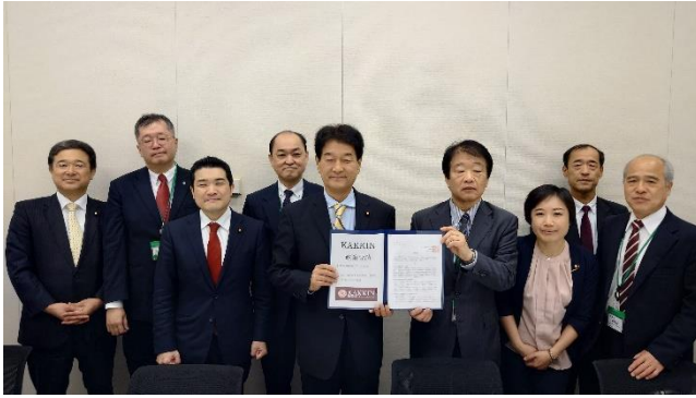
(中央左) 立憲民主党・大島敦衆議院議員、 4月18日