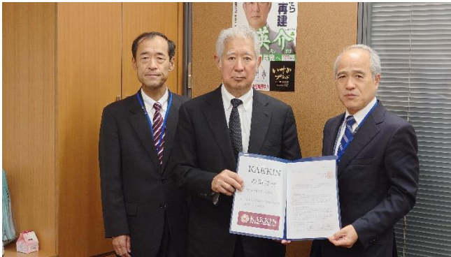
(中央) 自由民主党・森英介衆議院議員、 4月24日