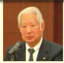
自由民主党 労政局長 衆議院議員 森 英介様