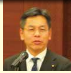
公明党 党核廃絶推進委員会事務局長 衆議院議員 平林 晃様