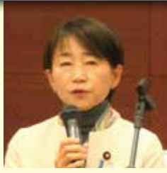
国民民主党代表 副幹事長 衆議院議員 西岡秀子様