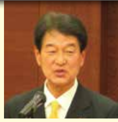
立憲民主党 企業・団体交流委員長 衆議院議員 大島 敦様