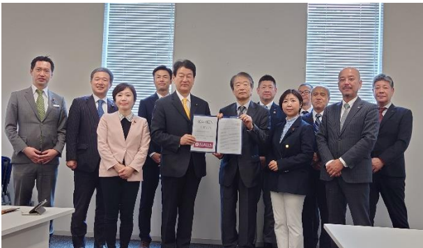
立憲民主党・大島敦衆議院議員（4月24日）