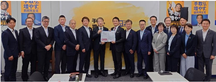
国民民主党・玉木雄一郎代表 （5月13日）