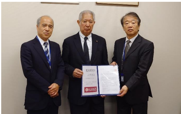
自由民主党・森英介衆議院議員（4月25日）