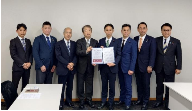
公明党・谷合正明参議院議員（4月25日）