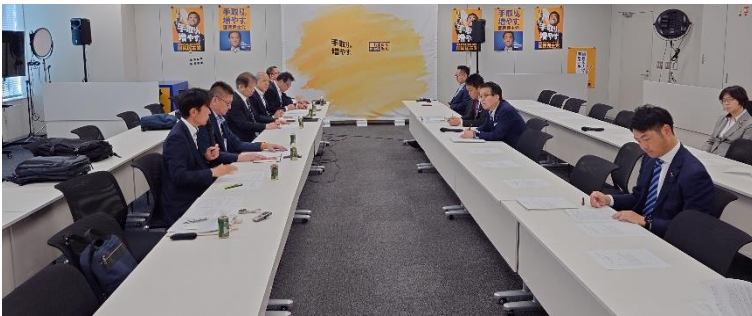
国民民主党との意見交換の様子